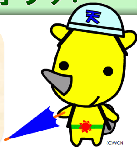
防災キャラクター 「サイぼうくん」

気象キャスターや気象予報士が学校へ伺い、専門的分野をわかりやすく説明し、自然災害や防災についての正しい知識を身につけるお手伝いをします。クイズ・実験・体験を通した楽しい授業です。ご応募をお待ちしております。